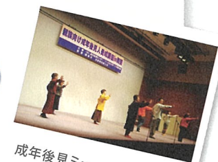
成年後見ミュージカルの様子